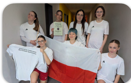
Fußball-EM der Mädchen in Schönefeld. Wir repräsentierten die polnische Mannschaft.

Wie angekündigt werden in dieser Woche unsere Mädchen der U18 in Frankfurt/Oder versuchen, bestmöglich beim Landesfinale im Handball abzuschneiden. Viel Erfolg!!!