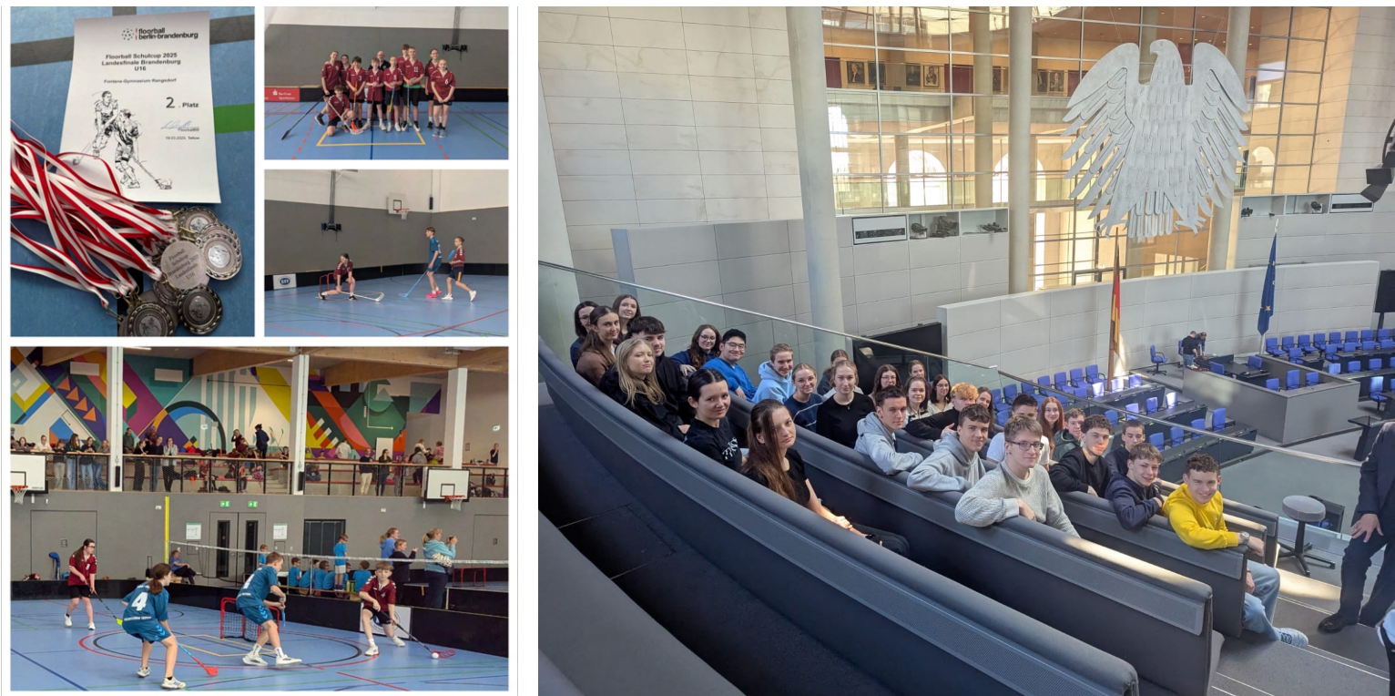
Floorballcup (Landesfinale) in Teltow und ein Besuch der Jahrgangsstufe 11 (Politikkurse) in Bundestag im Rahmen eines Planspiels.