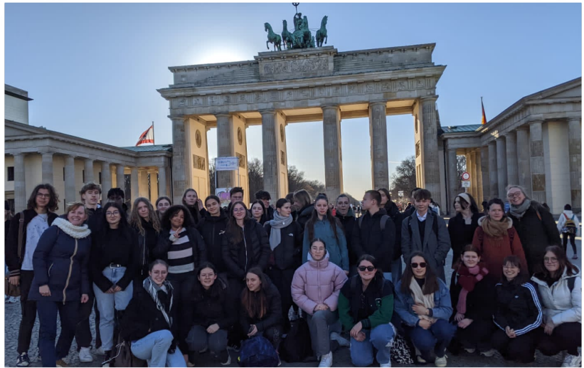
Exkursion im Rahmen unseres französischen Schüleraustausches nach Berlin