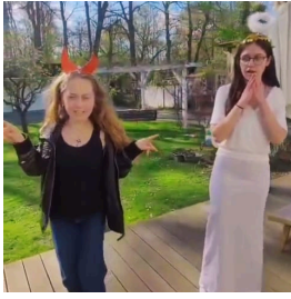
Impression der Faust-Inszenierung der 10b